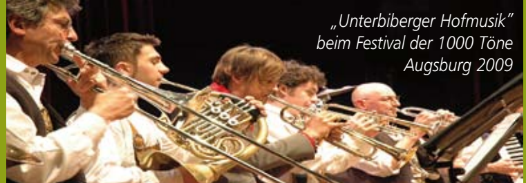
„Unterbiberger Hofmusik“ beim Festival der 1000 Töne Augsburg 2009