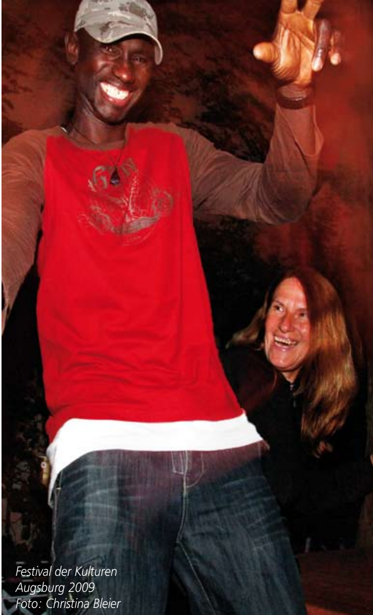
Festival der Kulturen Augsburg 2009

aktuelle Perspektiven der Kulturpolitik und die Interkulturelle Öffnung des Kulturbetriebs in der heterogenen Stadt – Theoretische Ansätze und Beispiele von Best Practice