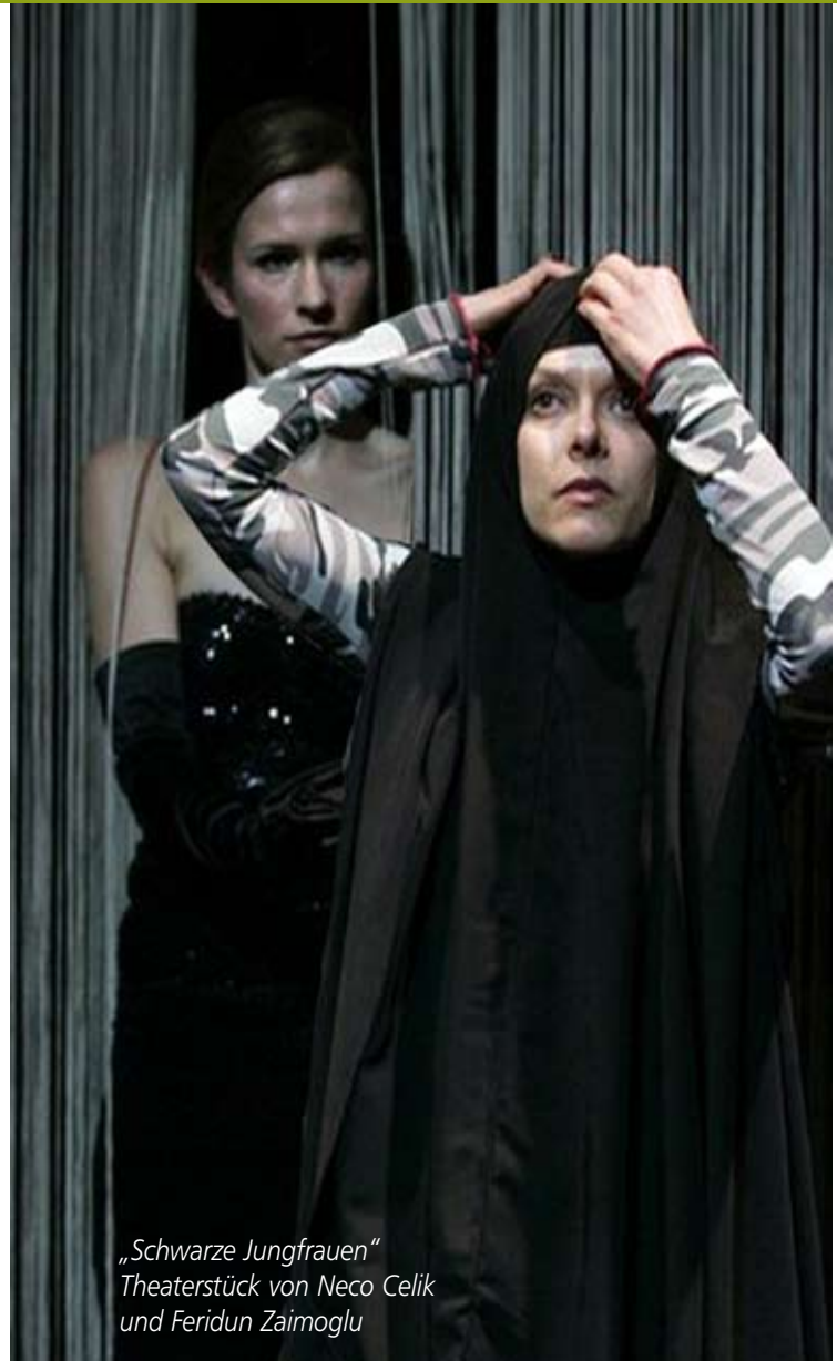
„Schwarze Jungfrauen“ Theaterstück von Neco Celik und Feridun Zaimoglu