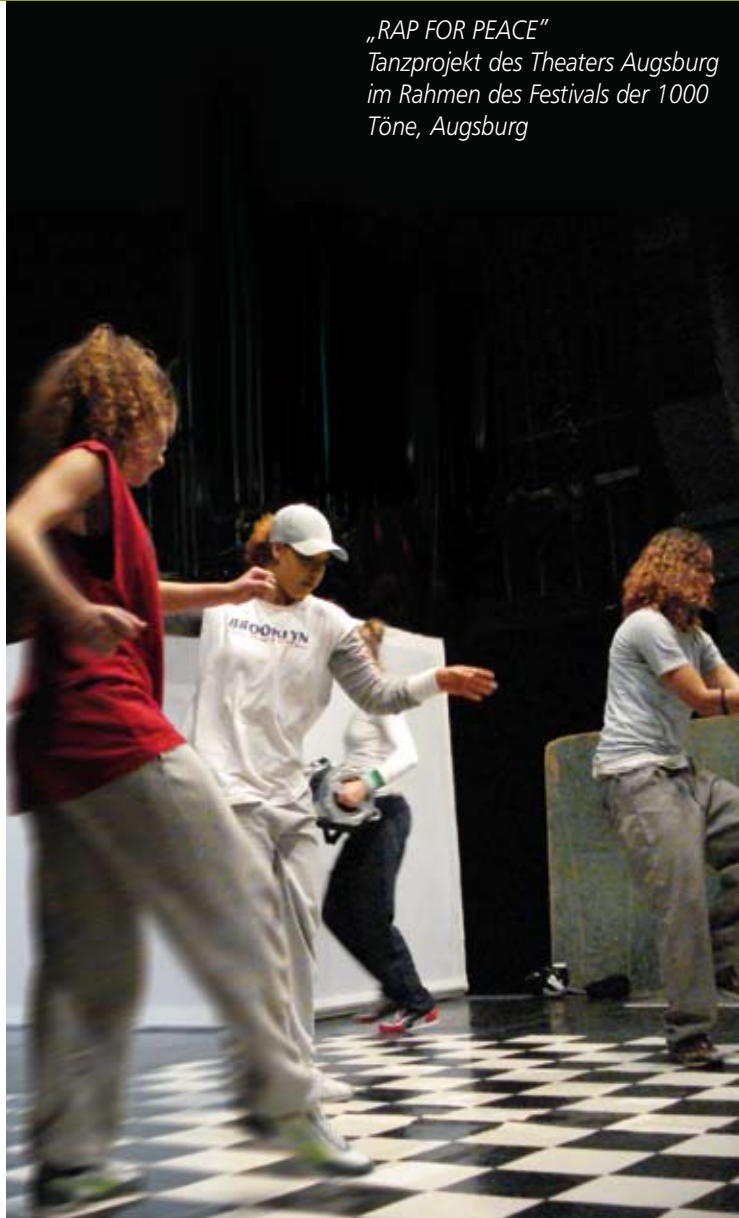
„RAP FOR PEACE“ Tanzprojekt des Theaters Augsburg im Rahmen des Festivals der 1000 Töne, Augsburg

aktuelle Perspektiven der Kulturpolitik und die Interkulturelle Öffnung des Kulturbetriebs in der heterogenen Stadt – Theoretische Ansätze und Beispiele von Best Practice